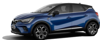
Metalická modrá Royal Blue / černá střecha