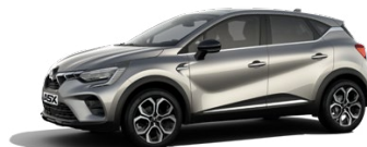
Metalická šedá Steel Grey