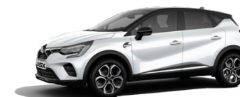
Prémiová metalická bílá Crystal White / černá střecha