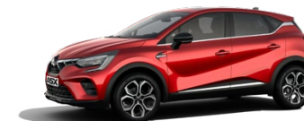
Prémiová metalická červená Sunrise Red