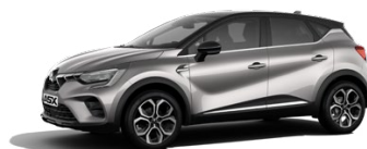
Metalická šedá Steel Grey / černá střecha