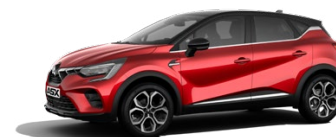
Prémiová metalická červená Sunrise Red / černá střecha