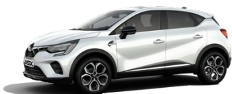
Prémiová metalická bílá Crystal White