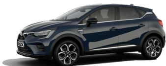
Standardní modrá Charcoal Blue