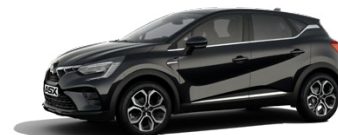
Metalická černá Onyx Black